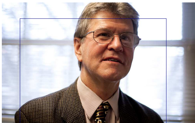
Philip Jenkins, profesor de la Universidad de Pensilvania

La acumulación de titulares periodísticos sobre casos de abusos sexuales a menores cometidos por sacerdotes católicos puede dar la impresión de que se trata de un fenómeno muy extendido; en realidad, concierne a un pequeño número de sacerdotes.